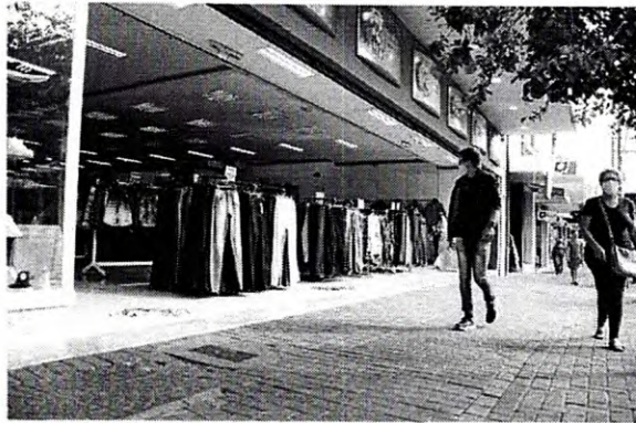
Até segunda-feira o comércio vai seguir o horário atual de funcionamento

creto 7.668/2021 nesta sexta-feira (14), que estende as regras que estão em vigor, atividades comerciais, como bares, restaurantes, shopping centers e comércio em geral, poderão funcionar neste final de semana condicionados a restrições de horário, ocupação, capacidade e modalidade de atendimento. Comércio de rua, shopping centers e museus estão autorizados a abrir ao público das 10h às 22h com limitação de 50% de ocupação – os