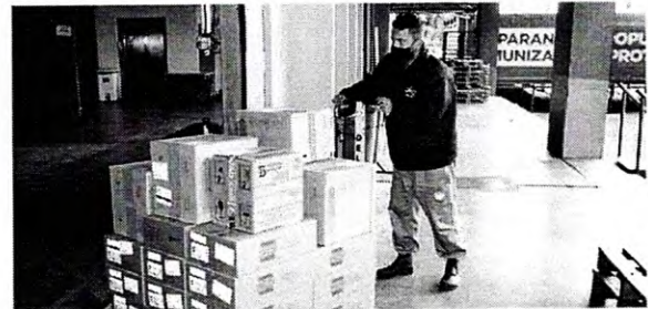
Mais de 170 mil medicamentos de kit de intubação foram encaminhados para regionais

A Secretaria de Estado da Saúde (Sesa) iniciou nesta sexta-feira (14) a distribuição de mais 170.285 medicamentos elencados no chamado “kit de intubação” para pacientes internados com coronavírus. Ao todo 59 hospitais do Plano de Atendimento Covid-19 nas 22 Regionais de Saúde irão receber os medicamentos.