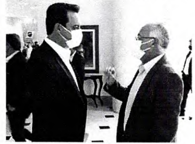
Governador Ratinho Junior com o vereador Poim, presidente da Câmara

O presidente da Câmara de Apucarana, vereador Francielei Preto Godoi Poim (PSD), voltou de Curitiba nesta sexta-feira com um saldo positivo da viagem que fez durante a semana para a Capital do Estado. Destaque para a liberação, feita pelo governador Ratinho Júnior (PSD), das 42 casas para o Distrito de Caixa de São Pedro.